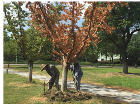
△ 今年的酷暑特别厉害,早晚的浇水已经不能满足有些不耐旱树种的需要,特别是在完全空旷、阳光直晒的地方。我校亦出现此种情况,绿化工人正在紧急救治,为树木松土透气、疏枝散叶。