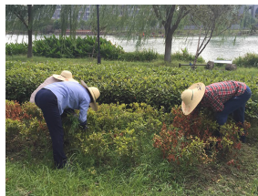
△ 日常的浇水以及温度的适宜使得杂草长得特别快,色块中的杂草只能靠人工拔除。绿化工人顶着烈日、弯着腰,在色块中清除杂草。