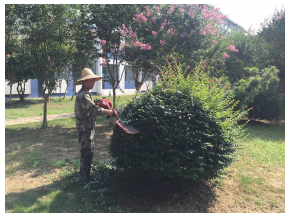
△ 烈日下,全校绿篱长势喜人,也等待着绿化工人的修剪。