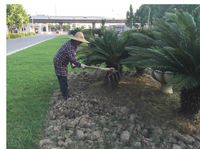
△ 开学在即,全校的草花区域又要开始栽植各种花卉,绿化工人们正在提前翻土,为草花种植做准备。