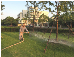
△ 早晨5点多,假期的校园还处在宁静之中,空旷的校园内基本见不到人,唯有绿化工人,已经拿着水管在为一片绿色浇水了。