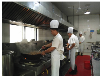
△ 子悦餐厅厨师准备菜肴

另一方面承担了大量各类成教培训项目的就餐。子悦餐厅作为暑期东湖校区值班学生食堂,一切为了学生着想,丰富菜肴种类、提高菜肴口感,较好的满足的广大学生的暑期就餐需求。同时,餐饮服务中心还为暑期留校的学生提供洗浴和饮水需求,充分保障了学生的生活所需。