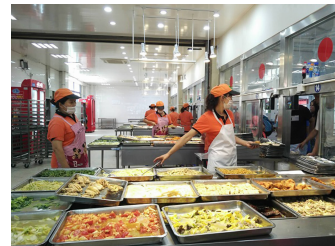
△ 子悦餐厅丰盛的菜肴