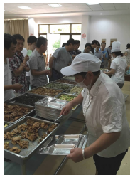
△ 教工餐厅为成教培训学员提供服务