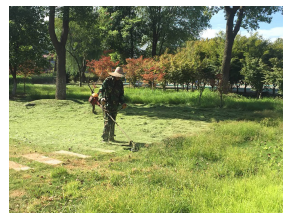
△ 艳阳炙烤下,草坪上的草已经长得参差不齐。绿化工人正在为一块块草坪区域做打草平整工作。