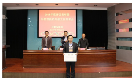
新闻宣传先进集体: 餐饮服务中心